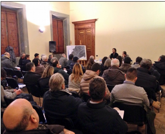
Riunione territoriale Capezzano Pianore 20/02/2015

potuto avere un quadro più chiaro e dettagliato circa alcune scelte strategiche considerate prioritarie dall'Amministrazione Comunale.