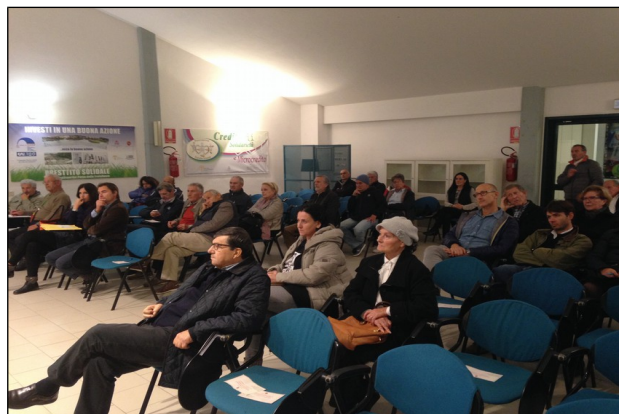
Lido di Camaiole – 29/10/2015