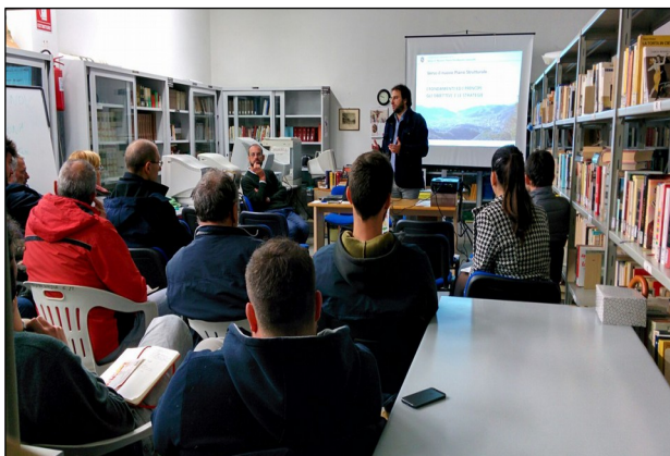
Orbicciano – 28/10/2015