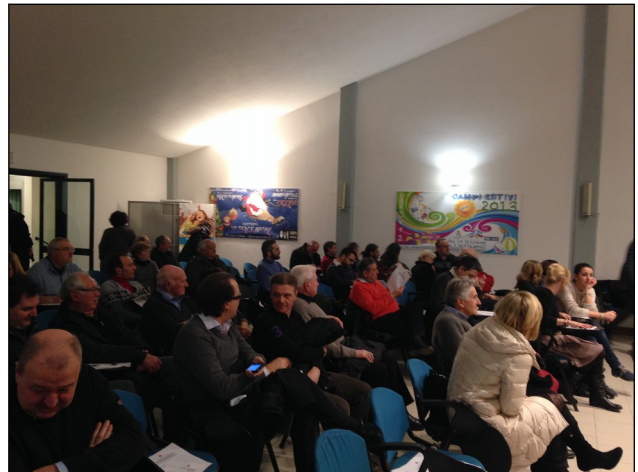
Riunione territoriale Lido di Camaiore 13/02/2015