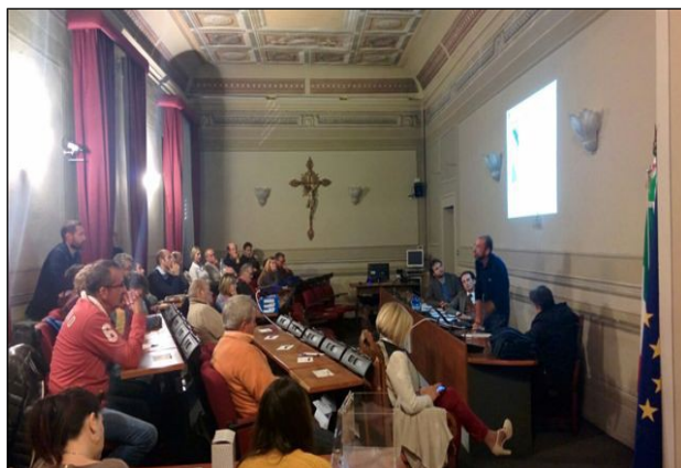
Camaiole – 21/10/2015