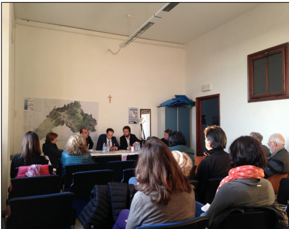
Riunione tematica "Agricoltura e territorio rurale" 27/03/2015