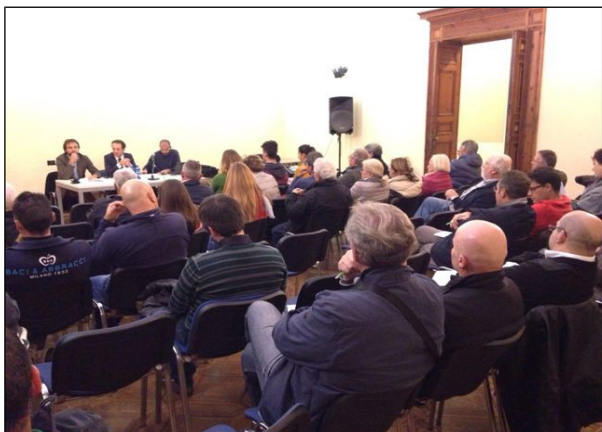
Capezzano Pianore - 22/10/2015

Un ulteriore canale di comunicazione, inoltre, è stato rappresentato dai Garanti di zona, i quali hanno contribuito a diffondere l'informativa presso i residenti e le realtà organizzate presenti nelle rispettive "zone di competenza".