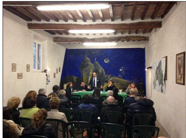
Riunione tematica "Il patrimonio territoriale" 23/03/2015