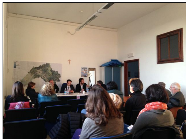
Riunione tematica "Agricoltura e territorio rurale" 27/03/2015