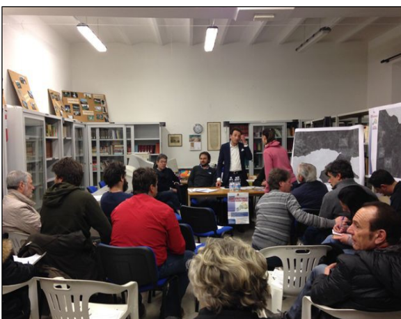
Riunione territoriale Seimiglia 20/03/2015